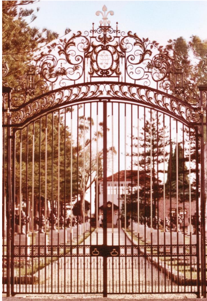
巴吉大厦的柯林斯大门

成为巴哈伊信徒之后，她对门的渴望变得淡漠了，她所关注的已从世间的事物转到了为信仰的服务中。多年后，她在以色列海法的巴哈伊世界中心服务时，她为圣护捐款，希望这些捐赠能有助于圣护的个人需要。一段时间后，她收到了守基·埃芬迪的一封信，里面附有一张照片。照片上是一座美丽的大门，被安放在一条路径的起点上。这条路径最终通往巴哈欧拉的陵寝。守基·埃芬迪用阿米莉亚的捐赠购置了这扇门，就是今天我们熟知的柯林斯大门。