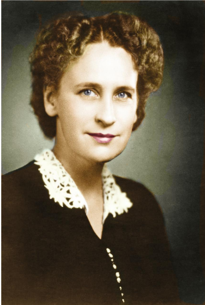
圣辅多萝西·贝克的肖像