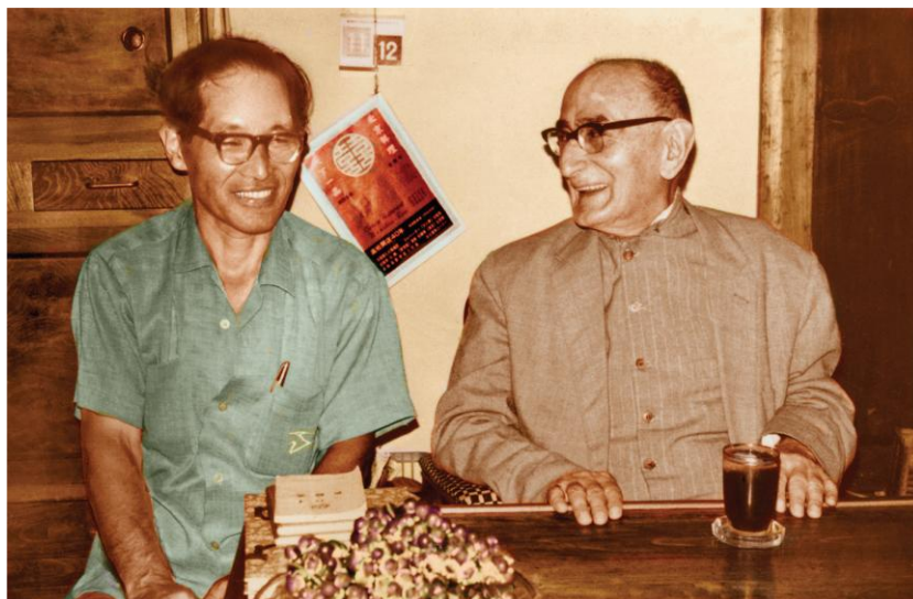
圣辅塔拉祖拉·萨曼达里与日本信徒 1966年摄于日