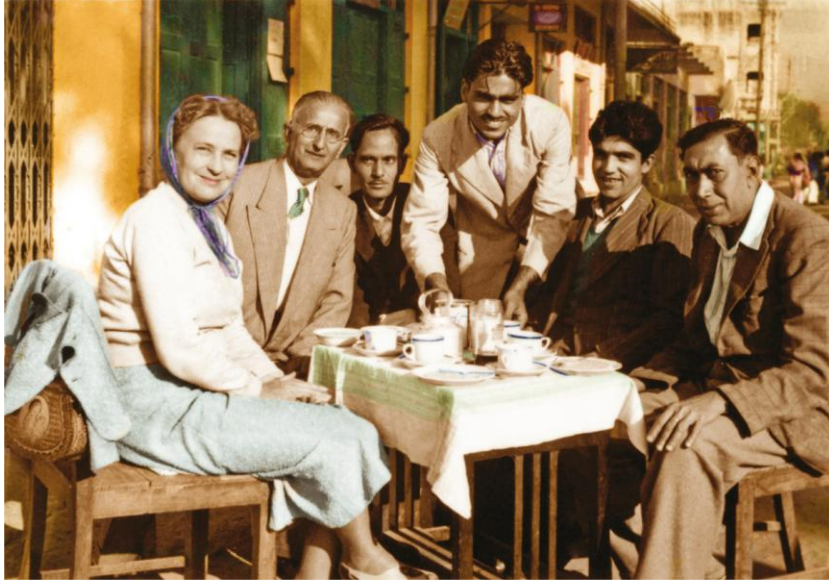
圣辅多萝西·贝克访问印度北方邦瓦拉纳西， 与朋友们合影。约 1953 年前后。

她的最后一次公开露面是在巴基斯坦的卡拉奇，她在那里与当地的巴哈伊朋友进行了交谈。当她要求志愿者离开家园到其他地方去传导信仰时，有 19 位朋友报名参加。多萝西为此非常感动，她真诚地告诉大家：“哦，天哪！我没有没有什么可以给你们！我把我的生命、我的爱送给你们。”