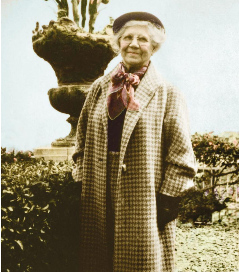
圣辅阿米莉亚·柯林斯 于 1950 年摄于以色列