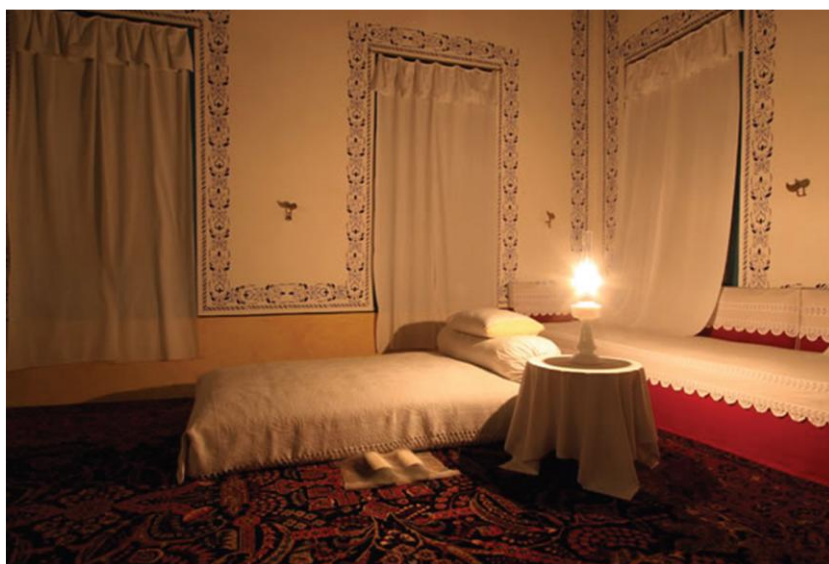
巴吉大厦巴哈欧拉的房间