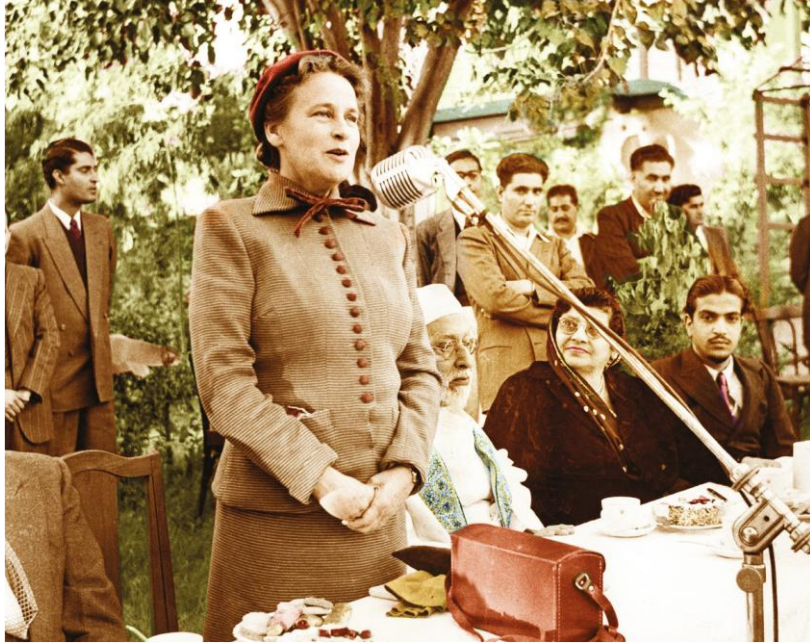
多萝西·贝克 1954 年 1 月 9 日在访问卡拉奇 (今巴基斯坦)时发表演讲

括恐惧、怀疑和沮丧等，抛在脑后。她坚信，信仰需要人人做出贡献。她鼓励自己放下包袱、勇往直前。