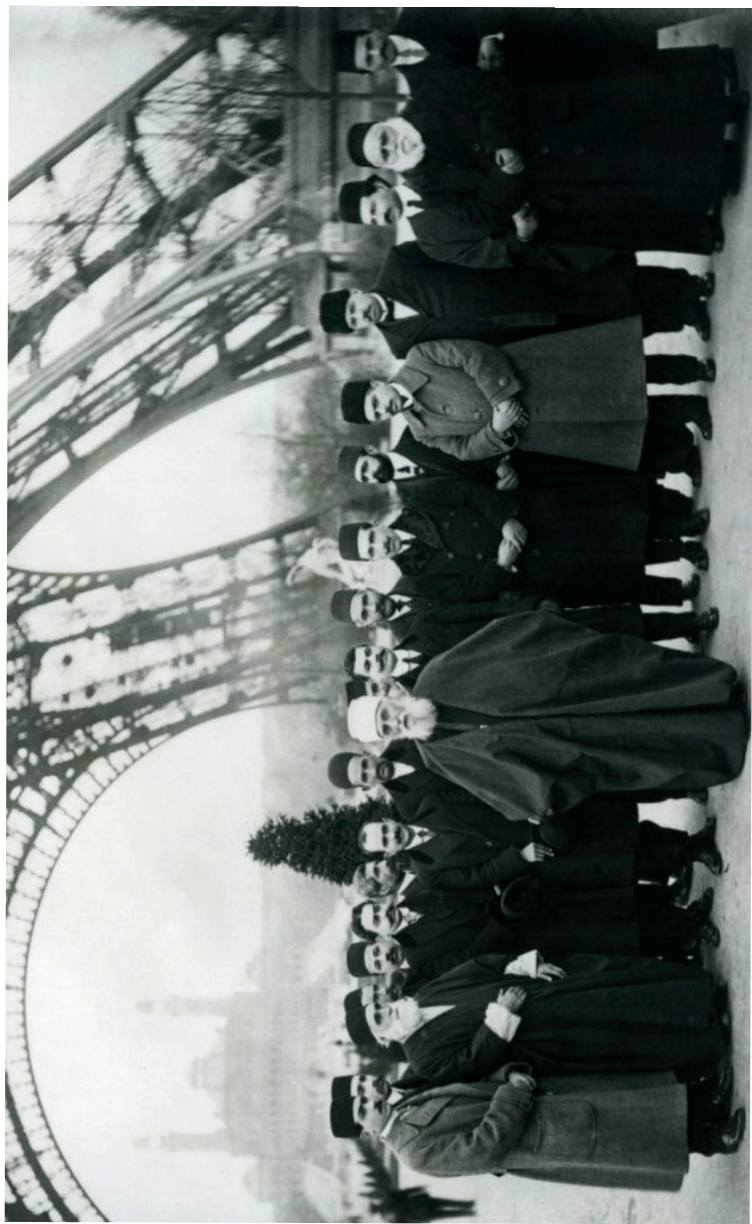
阿博都-巴哈1912年访问欧洲时与其朋友们的合影