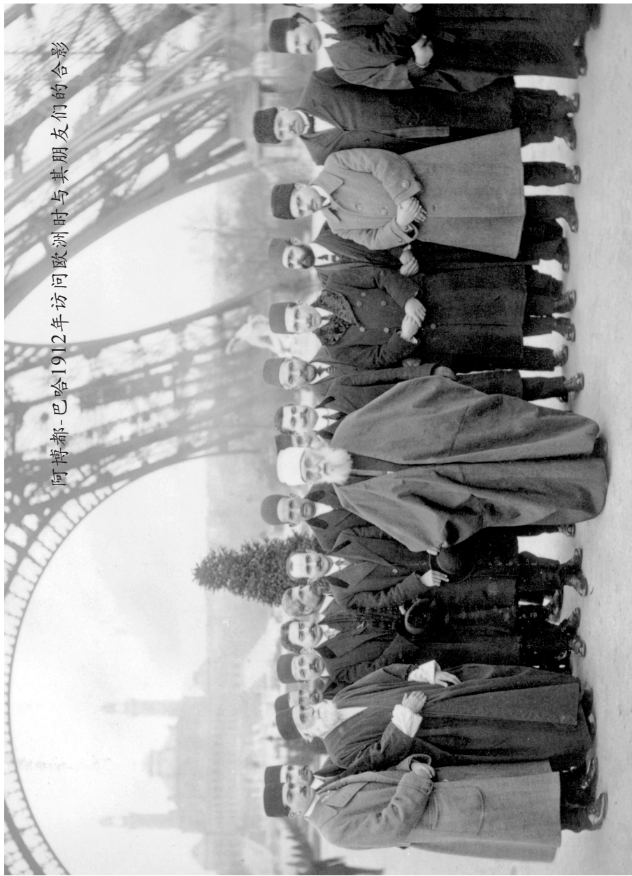
阿博都-巴哈1912年访问欧洲时与其朋友们的合影